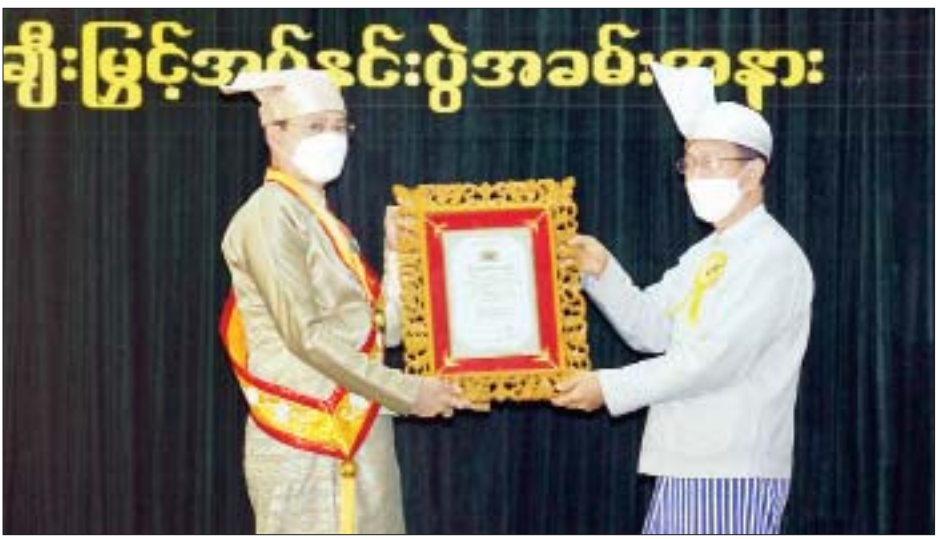
နေပြည်တော်ကောင်စီဥက္ကဋ္ဌ ဒေါက်တာမောင်မောင်နိုင် သာသနာ့နဂ္ဂဟဘွဲ့ရသူတစ်ဦးအား ဘွဲ့တံဆိပ်နှင့် အဆောင်အယောင်များ ချီးမြှင့်အပ်နှင်းစဉ်။

တော်မြတ်ကြီး” တည်ထားကိုးကွယ်နိုင်ရေးအတွက် စကျင်ကျောက်တော်ကြီး တူးဖော်ခဲ့သည့် အခြေ အနေ၊ နေပြည်တော်သို့ ပင့်ဆောင်ခဲ့သည့် အခြေ အနေ၊ ပလ္လင်တော်နှင့် ကိုယ်ထည်ပိုင်းတို့အား ထုဆစ်ခြင်းနှင့် တွဲဆက်ခြင်းလုပ်ငန်းများကို ဆက်လက်ဆောင်ရွက်လျက်ရှိသည့် အခြေအနေ၊ ပိဋကတ်သုံးပုံ ကျောက်စာများကို ကျောက်စာချပ် များပေါ်၌ ရေးထိုးပူဇော်နိုင်မည့် အခြေအနေ၊ တည်ဆောက်ပူဇော်ရေးလုပ်ငန်းများ ဆောင်ရွက် လျက်ရှိသည့် အခြေအနေများနှင့်ပတ်သက်၍ ရှင်းလင်းပြောကြားသည်။ ထို့နောက် ၂၀၂၁ ခုနှစ် သာသနာတော်ဆိုင်ရာ သာသနာ့နဂ္ဂဟဘွဲ့တံဆိပ် ရရှိသူများသည် ဗုဒ္ဓ ဥယျာဉ်တော်အတွင်း လှည့်လည်၍ ဗုဒ္ဓရုပ်ပွားတော် မြတ်ကြီးတည်ဆောက်နေမှု အခြေအနေများအား လိုက်လံကြည့်ရှုကြည့်ညိခဲ့ကြကြောင်း သိရသည်။ သတင်းစဉ်