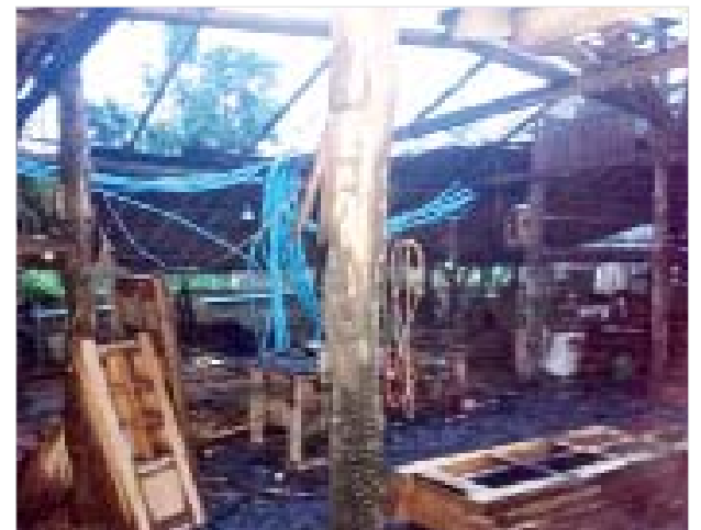
လောင်းလုံးမြို့ ရတနာများ၏နေအိမ် မီးရှို့ခံရမှု။