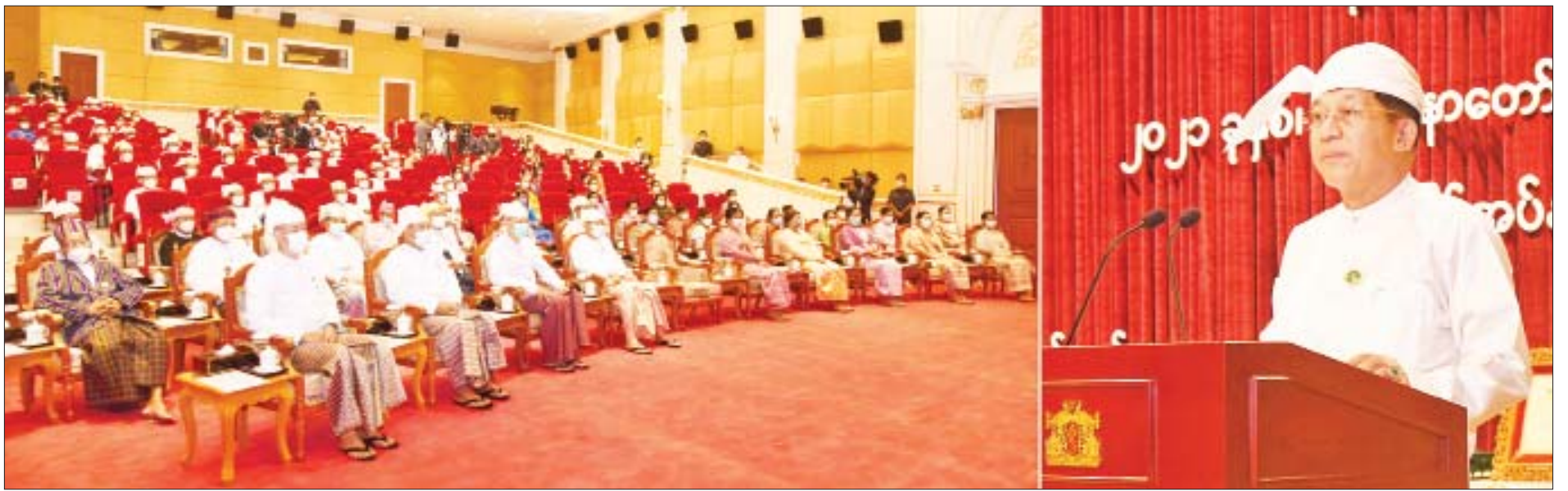
နိုင်ငံတော်စီမံအုပ်ချုပ်ရေးကောင်စီဥက္ကဋ္ဌ၊ နိုင်ငံတော်ဝန်ကြီးချုပ် ဗိုလ်ချုပ်မှူးကြီး မင်းအောင်လှိုင် ပြည်ထောင်စုသမ္မတမြန်မာနိုင်ငံတော် နိုင်ငံတော်စီမံအုပ်ချုပ်ရေးကောင်စီ ၂၀၂၁ ခုနှစ် သာသနာတော်ဆိုင်ရာ သာသနာ့ဥပဒေတို့ကို ချမှတ်ခြင်းအခမ်းအနားတွင် ဂုဏ်ပြုအမှာစကားပြောကြားစဉ်။

★ ရှေ့ဖိုးမှ ဦးစွာ နိုင်ငံတော်စီမံအုပ်ချုပ်ရေးကောင်စီဥက္ကဋ္ဌ၊ နိုင်ငံတော်ဝန်ကြီးချုပ် ဗိုလ်ချုပ်မှူးကြီး မင်းအောင်လှိုင် က ဂုဏ်ပြုအမှာစကားပြောကြားရာတွင် မြတ်စွာဘုရားရှင်၏ သာသနာတော်မြတ်ကြီး စဉ်ဆက်မပြတ် တိုးတက်ထွန်းကား ပြန့်ပွားစေရန်အတွက် သံဃာတော်အရှင်သူမြတ်များက ဂန္ဓဓုရ၊ ဝိပဿနာဓုရ ဟူသော ဓုရနှစ်ဖြာသာသနာကို အားသွန်ခွန်စိုက်ကြီးစားအားထုတ်ကြပြီး နိုင်ငံသူ နိုင်ငံသားအပေါင်းအား ပစ္စုပ္ပန်၊ သံသရာကြီးပွားရာ ကြီးပွားကြောင်း နည်းလမ်းကောင်းများကို အခွင့်အခါသင့်တိုင်း ဟောကြားပြသလျက်ရှိကြပါကြောင်း၊ ဗုဒ္ဓဘာသာဝင် နိုင်ငံသူ နိုင်ငံသားများကလည်း သာသနာတော်အတွက် မရှိမဖြစ်လိုအပ်သည့် ဆွမ်း၊ သင်္ကန်း၊ ကျောင်း၊ ဆေး လေးပါးသောပစ္စည်းများကို ကြည်လင်သည့် သဒ္ဓါတရား၊ ထက်သန်သည့် စေတနာအားများဖြင့် ထောက်ပံ့လှူဒါန်းလျက်ရှိကြပါကြောင်း၊ ဤကဲ့သို့ အလှူရှင်အပေါင်းတို့၏ စေတနာသဒ္ဓါတရားတို့ကို နိုင်ငံတော်အစိုးရအနေဖြင့် နှစ်စဉ် အားပေး အသိအမှတ်ပြု ဆောင်ရွက်ခြင်းဖြစ်သည့် မဟာကုသိုလ်တော်တစ်ရပ်မှာ သာသနာ့ဒါယကာ ဒါယိကာမများကို သာသနာတော်ဆိုင်ရာ နဂုဟဘွဲ့တံဆိပ်များ ချီးမြှင့်အပ်နှင်းခြင်းပင် ဖြစ်ကြောင်း။