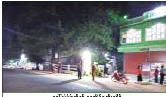
ဒေါ်ဖြူဖြူထိုက် နေအိမ်စတိုးဆိုင်