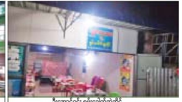
ဦးအောင်ဝင်း ရှမ်းခေါက်ဆွဲဆိုင်