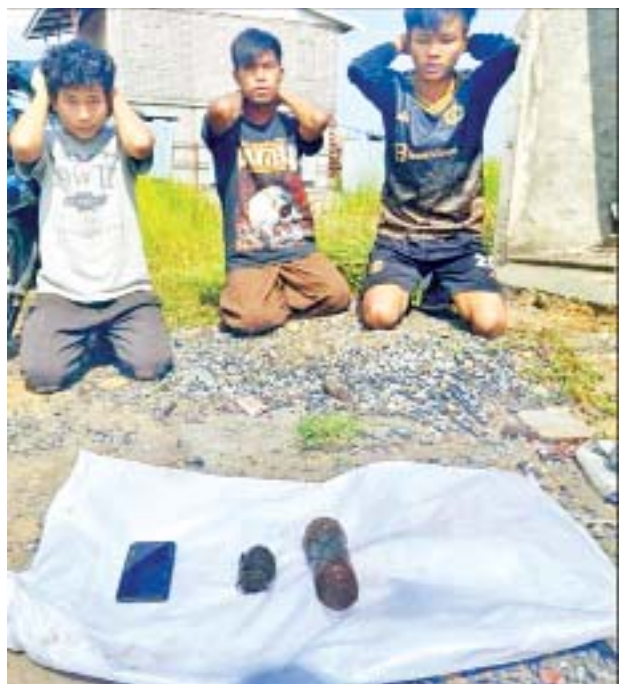
YDF အကြမ်းဖက်အဖွဲ့ထံမှ သိမ်းဆည်းရမိသည့် လက်ပစ်ဗုံးနှင့် လက်လုပ်မိုင်းများ မှတ်တမ်းဓာတ်ပုံ။