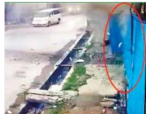
မူဆယ်မြို့၌ လက်လုပ်မိုင်း တစ်လုံး ပေါက်ကွဲမှု။