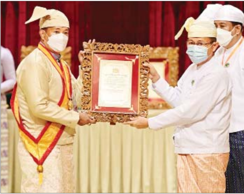
နိုင်ငံတော်စီမံအုပ်ချုပ်ရေးကောင်စီ ဒုတိယဥက္ကဋ္ဌ၊ ဒုတိယဝန်ကြီးချုပ် ဒုတိယဗိုလ်ချုပ်မှူးကြီးစိုးဝင်း အဂ္ဂမဟာသီရိသုဓမ္မ မဏိဇောတဓရဘွဲ့ရ ဒေါက်တာလှဝင်းအောင်အား ဘွဲ့တံဆိပ်နှင့် အဆောင်အယောင်များ ချီးမြှင့်အပ်နှင်းစဉ်။