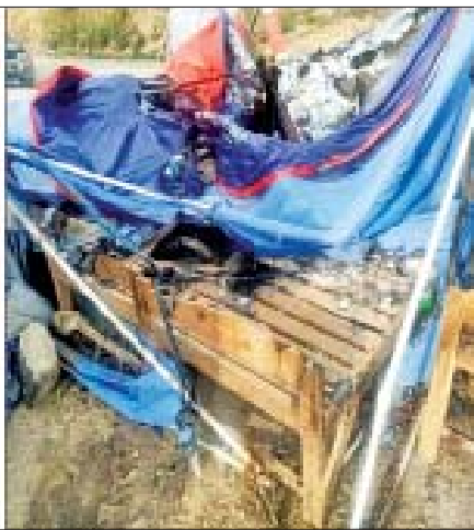
တီးတိန်မြို့နယ်၌ မြို့ဝင်/ထွက် ပူးပေါင်းစစ်ဆေးရေးဂိတ်အား မီးရှို့ဖျက်ဆီးမှု။