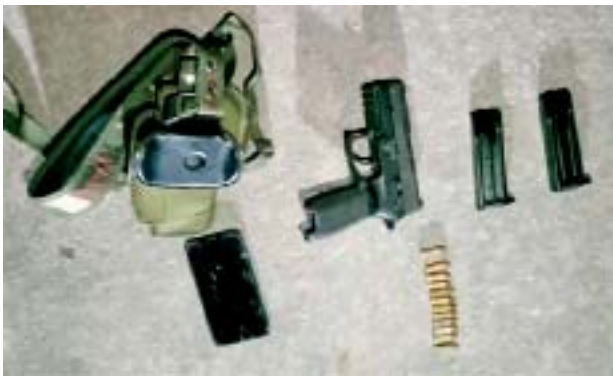
နောင်ရိုးအကြမ်းဖက်အဖွဲ့ဝင် အောင်ဖြိုး(ခ)ကိုဖြိုး(ခ)ကိုစိုးထံမှ သိမ်းဆည်းရမိသည့် လက်နက်/ခဲယမ်းများ မှတ်တမ်းဓာတ်ပုံ။