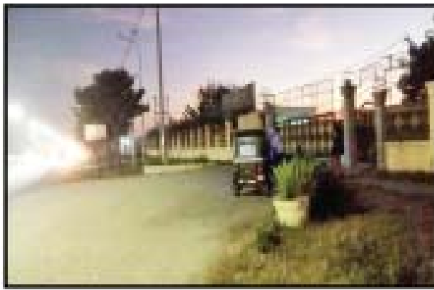
အောက်တိုဘာလ ၂၁ ရက်တွင် မဟာအောင်မြေမြို့နယ် မန္တလေး-ပြင်ဦးလွင်သွား ကားလမ်းဘေးရှိ Royal One KTV ဆိုင်အနီးတွင် လက်လုပ်ဖုံး တစ်လုံးဖြင့် ပစ်ခတ်ဖောက်ခွဲမှု မှတ်တမ်းဓာတ်ပုံ။