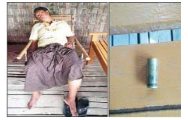
စက်တင်ဘာလ ၂၄ ရက်တွင် ပြည်ကြီးတံခွန်မြို့နယ် (၈)ရပ်ကွက် တွင် နေထိုင်သည့် အပြစ်မဲ့ပြည်သူတစ်ဦးအား ဒလန်ဟုစွပ်စွဲ၍ ပစ်ခတ်သတ်ဖြတ်ခဲ့သည့် မှတ်တမ်းဓာတ်ပုံ။