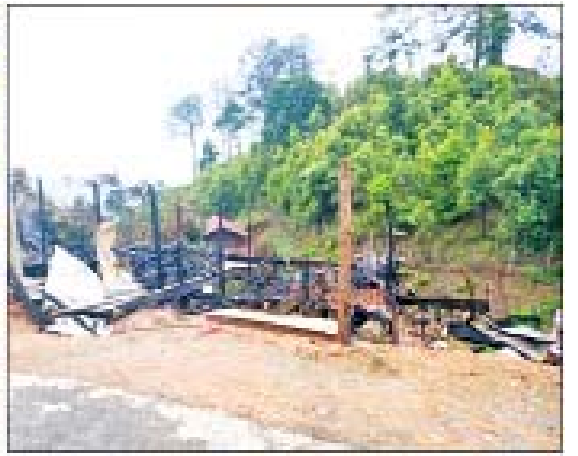
ကန်ပက်လက်မြို့၌ မီးရှို့မှု။