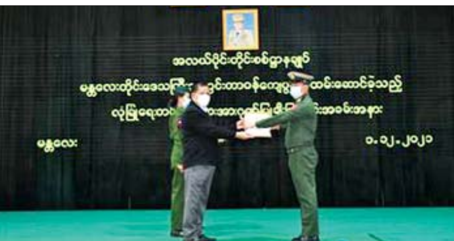
ဝန်ကြီးချုပ်၊ တိုင်းမှူးနှင့် တာဝန်ရှိသူများက ဂုဏ်ပြုမှတ်တမ်းလွှာများ ပေးအပ်ခဲ့ကြကြောင်း သတင်းရရှိသည်။

နေပြည်တော် ဒီဇင်ဘာ ၁ မန္တလေးတိုင်းဒေသကြီးအတွင်း လက်နက်၊ ခဲယမ်းများ၊ အဖျက်အမှောင် ဖောက်ခွဲဖျက်ဆီးခြင်းများ ပြုလုပ်ရာတွင် အသုံးပြုသည့် ဆက်စပ်ပစ္စည်းများ၊ မူးယစ်ဆေးဝါးများနှင့် ဘဏ်စာပြတိုက်မှု ဖြစ်စဉ်များတွင် ဖမ်းဆီးရမိရေး စွမ်းစွမ်းတမ်း တြိုးပမ်းဆောင်ရွက်ခဲ့ကြသည့် လုံခြုံရေးတပ်ဖွဲ့ဝင်များအား ဂုဏ်ပြုချီးမြှင့်ခြင်းကို ယနေ့နံနက်ပိုင်းတွင် အလယ်ပိုင်းတိုင်းစစ်ဌာနချုပ် အားကစားခန်းမ၌ ပြုလုပ်ရာ တိုင်းဒေသကြီး ဝန်ကြီးချုပ် ဦးမောင်ကို၊ တိုင်းမှူး ဗိုလ်ချုပ်ကိုဦး၊ တာဝန်ရှိသူများနှင့် လုံခြုံရေးတပ်ဖွဲ့ဝင်များ တက်ရောက်ကြသည်။ ရှေးဦးစွာ တိုင်းဒေသကြီးဝန်ကြီးချုပ်က အဖွင့်အမှာစကား ပြောကြားသည်။ ထို့နောက်