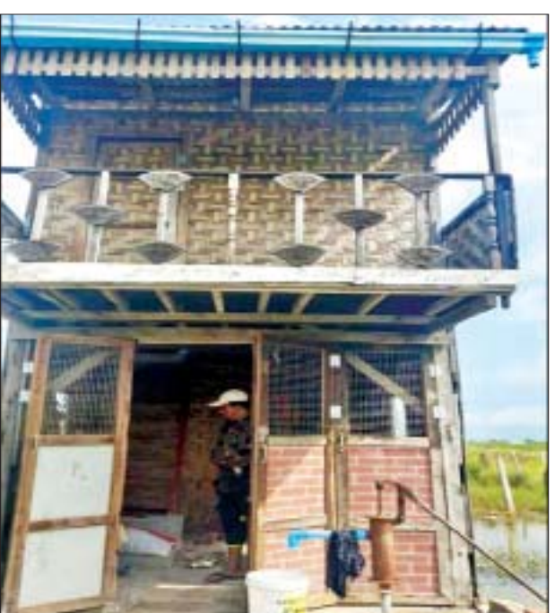
YDF အကြမ်းဖက်အဖွဲ့ဝင်များ နေထိုင်သည့် Safe House မှတ်တမ်း ဓာတ်ပုံ။