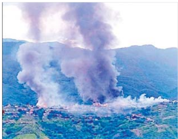
ထန်တလန်မြို့ မီးရှို့ဖျက်ဆီးခံရမှု။