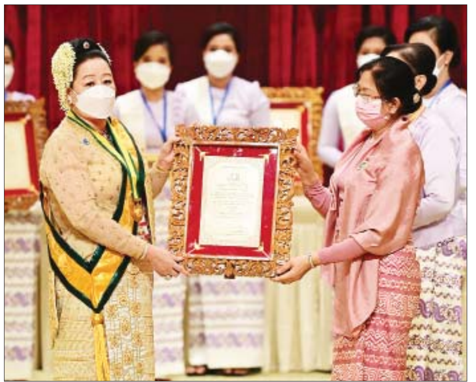
နိုင်ငံတော်စီမံအုပ်ချုပ်ရေးကောင်စီဥက္ကဋ္ဌ၊ နိုင်ငံတော်ဝန်ကြီးချုပ် ဗိုလ်ချုပ်မှူးကြီး မင်းအောင်လှိုင်၏ ဇနီး ဒေါ်ကြူကြူလှ အဂ္ဂမဟာသီရိသုဓမ္မသီရိ ဘွဲ့ရ ဒေါ်သန်းမြအား ဘွဲ့တံဆိပ်နှင့် အဆောင်အယောင်များ ချီးမြှင့်အပ်နှင်းစဉ်။

အထူးအလေးထား ကြိုးစားဆောင်ရွက်သွားမည် ထို့ကြောင့် မိမိတို့နိုင်ငံတော်စီမံအုပ်ချုပ်ရေး ကောင်စီအနေဖြင့်လည်း ဗုဒ္ဓဘာသာဝင် နိုင်ငံသူ နိုင်ငံသားများနှင့်အတူ လှူဒါန်းထောက်ပံ့ရေးနှင့်အခြား ပံ့ပိုးဆောင်ရွက်ဖွယ်ရာများကို အထူးအလေးထား ကြိုးစားဆောင်ရွက်သွားမည်ဖြစ်သည်ကို ထည့်သွင်း ပြောကြားလိုကြောင်း။