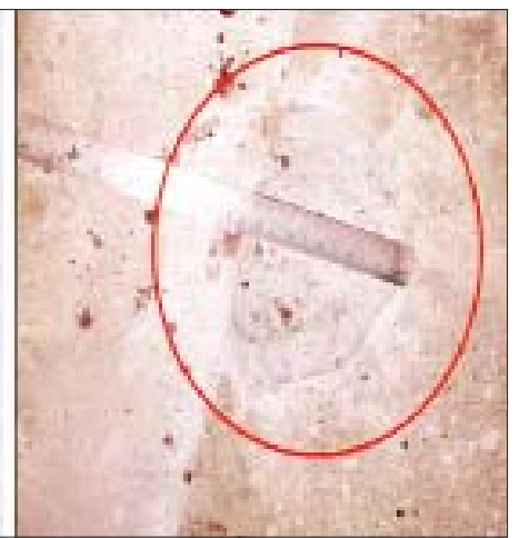
မိုင်းယောင်းမြို့၌ မိုင်းဖောက်ခွဲမှု။