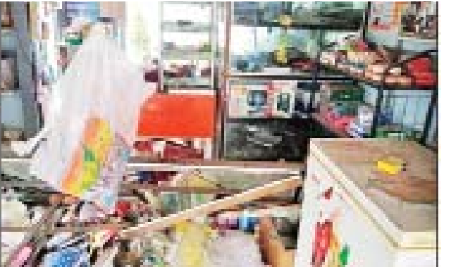
အောက်တိုဘာလ ၂၁ ရက်တွင် ပြည်ကြီးတံခွန်မြို့နယ် (၄)ရပ်ကွက်ရှိ ရွှေငါးစတိုးဆိုင်အား ဒလန်ဟုစွပ်စွဲ၍ လက်လုပ်ဖုံးဖြင့် ပြစ်ခတ် တိုက်ခိုက်ခဲ့သည့် မှတ်တမ်းဓာတ်ပုံ။