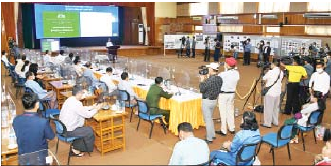
နိုင်ငံတော်စီမံအုပ်ချုပ်ရေးကောင်စီ သတင်းထုတ်ပြန်ရေးအဖွဲ့က သတင်းမီဒီယာများနှင့်တွေ့ဆုံ၍ (၁၀/၂၀၂၁) ကြိမ်မြောက် သတင်းစာရှင်းလင်းပွဲပြုလုပ်စဉ်။