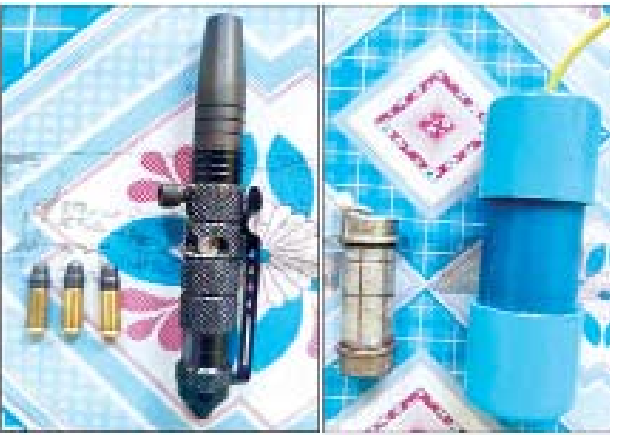
ဇင်ဝင်း(ခ)မျိုးချစ် (MPDF အကြမ်းဖက်အဖွဲ့)ထံမှ သိမ်းဆည်း ရမိသည့် လက်လုပ်သေနတ်နှင့် လက်လုပ်ဗုံးများ မှတ်တမ်းဓာတ်ပုံ။