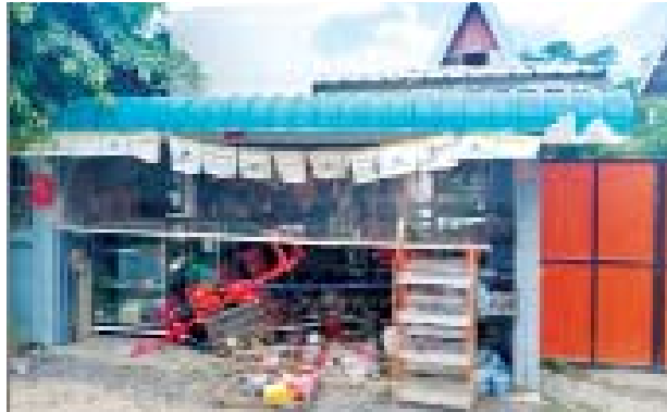
အောက်တိုဘာလ ၂၁ ရက်တွင် ပြည်ကြီးတံခွန်မြို့နယ် (၄)ရပ်ကွက်ရှိ ရွှေငါးစတိုးဆိုင်အား ဒလန်ဟုစွပ်စွဲ၍ လက်လုပ်ဖုံးဖြင့် ပြစ်ခတ် တိုက်ခိုက်ခဲ့သည့် မှတ်တမ်းဓာတ်ပုံ။